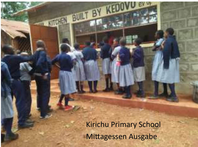
Kirichu Primary School Mittagessen Ausgabe