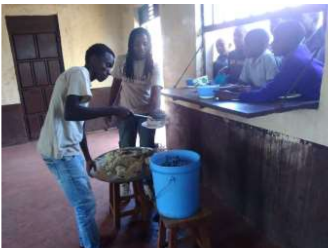
Ndurutu Primary School—Mittagessen :)