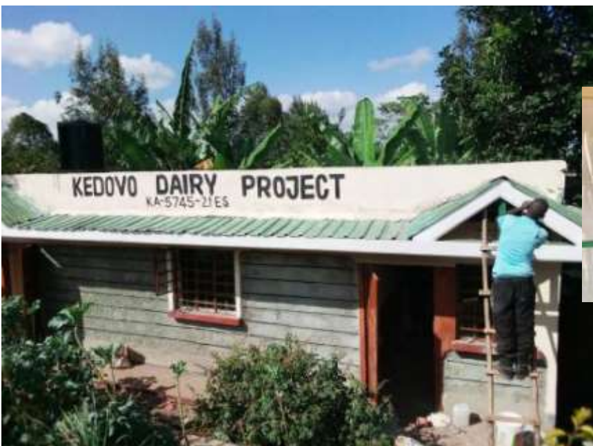
Der 1. Versuch

Bei Interesse für nähere Informationen senden wir Euch einen detaillierten Zwischenbericht zu.