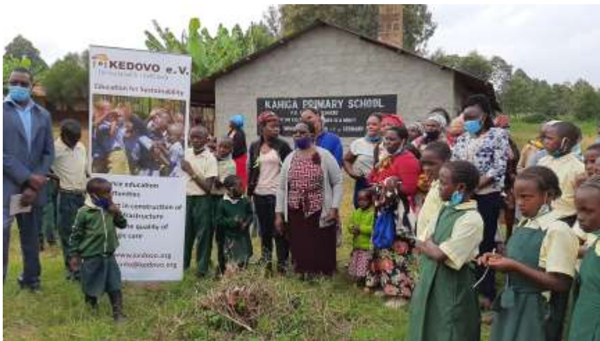
2021 Übergabe der renovierten Kahiga Primary School

Für diese Schulspeisungen sind wir weiter auf Unterstützung angewiesen.