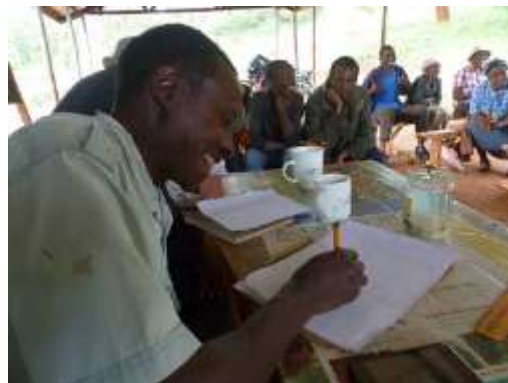
Farmer der Ndurutu Wet Mill bei der Diskussion und Abstimmung, an wen die nächste Ernte gehen soll.

2021 hatten wir bereits Ndurutu AB und Ndurutu PB kaufen können.