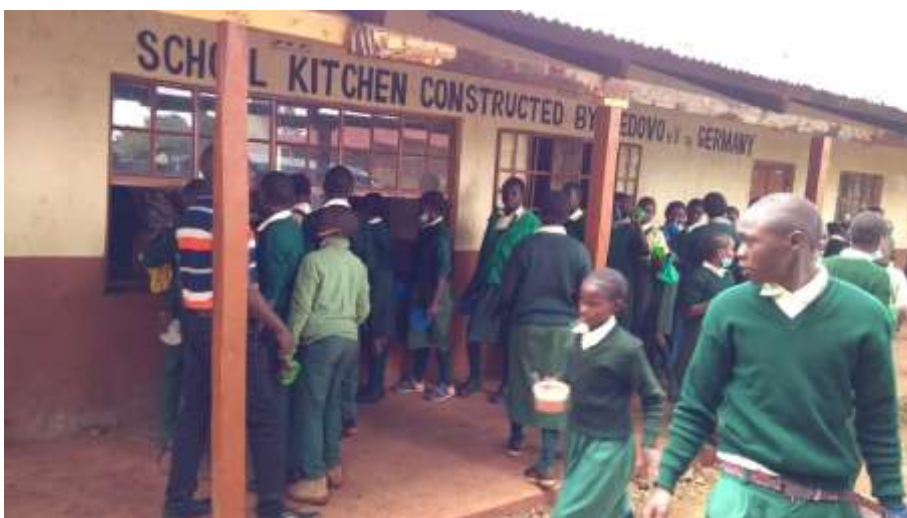
Kahiga Primary School Essenausgabe