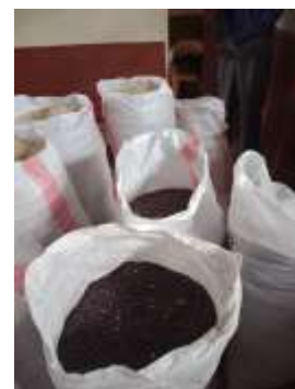
Mais und Bohnen werden dazu gekauft