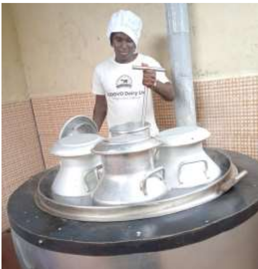
Kedovo Dairy Produktion