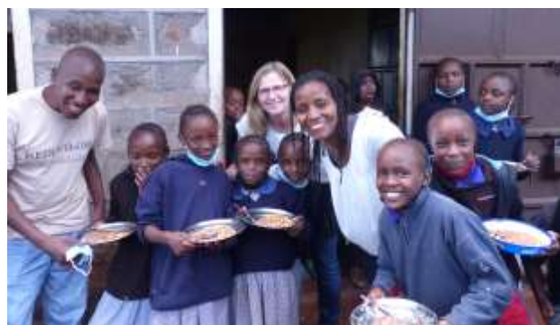
Schulspeisung an der Ndurutu Primary, wir sind auf Hilfe angewiesen, damit die Kinder weiterhin Essen bekommen können.