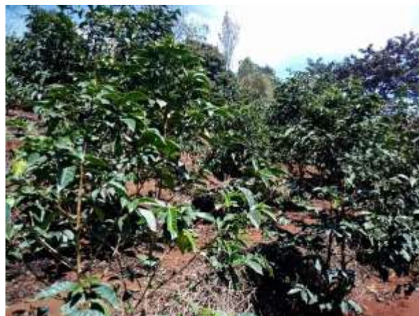
Durch die Dürre, sind leider auch die Kaffeepflanzen stark betroffen