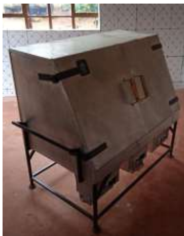
Der neue Ofen

Beheizt mit Briketts aus Kaffeeschalen etc.